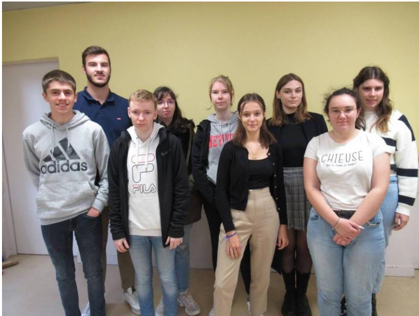
Les étudiants de la MFR en formation BTS technico-commercial.

Onze étudiants en BTS à la Maison familiale organisent une action, le mercredi 11 janvier 2023, dans trois magasins, pour aider l'association Un espoir pour les sans voix. Elle recueille et s'occupe d'animaux abandonnés et favorise leur adoption. Les jeunes pensent en particulier aux chats errants.