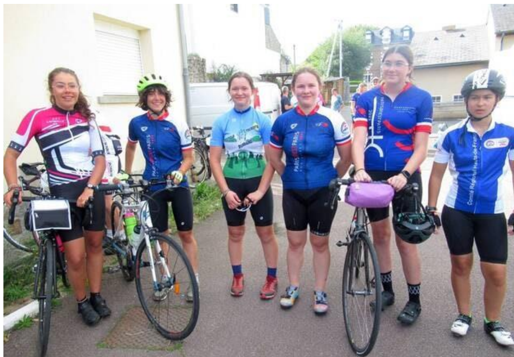
Lors de l'étape à La Ferté-Macé, les six jeunes filles (dont 3 Bagnolaises) participant au Paris-Brest-Paris. en plein écran

de la Manche vers Pontorson après avoir traversé les plantations de poiriers et pommiers du Domfrontais.