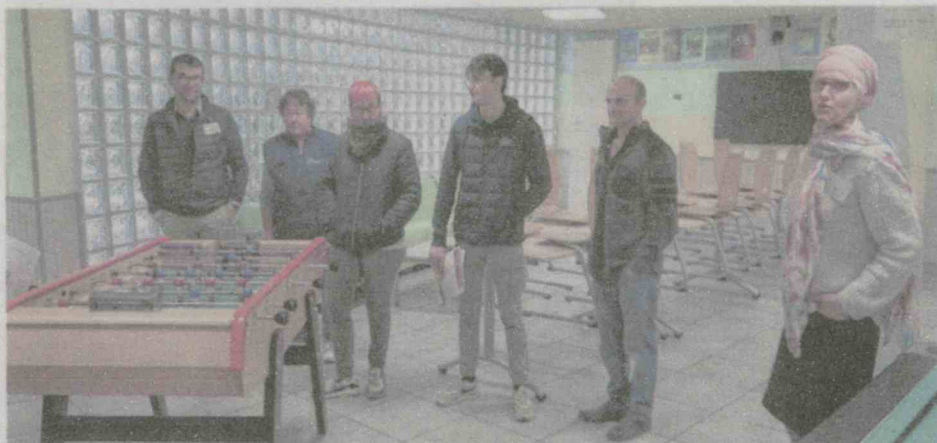
Impressions et convivialité dans le foyer de la MFR.

Le directeur rappelle que : « le recrutement s'effectue tout au long de l'année. C'est la particularité de la formation continue. Dans l'apprentissage, il y a toujours des places. Pour ces portes ouvertes, il y a déjà un intérêt porté aux filières Bac Pro, BTS et Technicien agricole. Un peu de BTS, aussi, mais le parcours sup a fermé deux jours avant. Il faudrait qu'elles soient organisées un peu avant à l'échelon régional ».