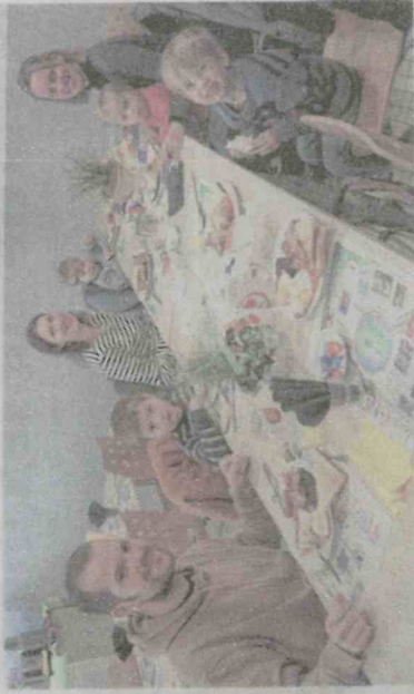
Des convives comblés. CF

nous souhaitons aller plus loin, et proposer aux élèves de participer à l'english breakfast. Un problème de date a empêché les 17 Bac Pro Conduite et gestion d'entreprise agricole d'être là aujourd'hui, mais ils ont pu construire et proposer une présentation en anglais d'élèves ou d'exploitations avec qui ou dans lesquelles ils sont en apprentissage. Un QR code permet même d'écouter leur présentation – toujours en anglais «.