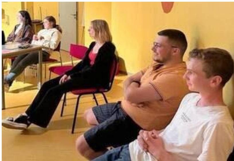
Un groupe d'élèves lors de la présentation du stage à l'étranger.

La MFR-CFTA a organisé une soirée pour la présentation des stages à l'étranger réalisés par des élèves lors de leurs séjours de deux à huit semaines dans le cadre d'Erasmus + et de Pass Monde région Normandie. Ce séjour concernait quinze élèves en bac pro, vingt en BTS.