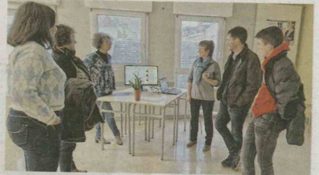
L'occasion d'échanges avec les familles de futurs élèves.

Depuis le 1 er septembre 2022, une nouvelle formation a vu le jour « avec un BTS de Technico-Commercial (Biens et Services pour l'agriculture) en apprentissage avec