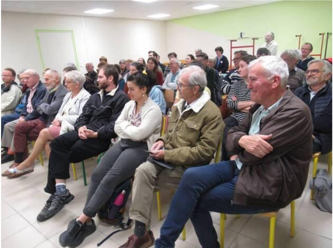
Durant tout le week-end, de nombreux participants ont échangé sur le thème de la semence à l'assiette. en plein écran

À partir de jouets, elle a aussi présenté ce qui a favorisé l'agriculture intensive et ses limites. L'intervenante a surtout voulu montrer les intérêts des circuits courts et du commerce équitable.