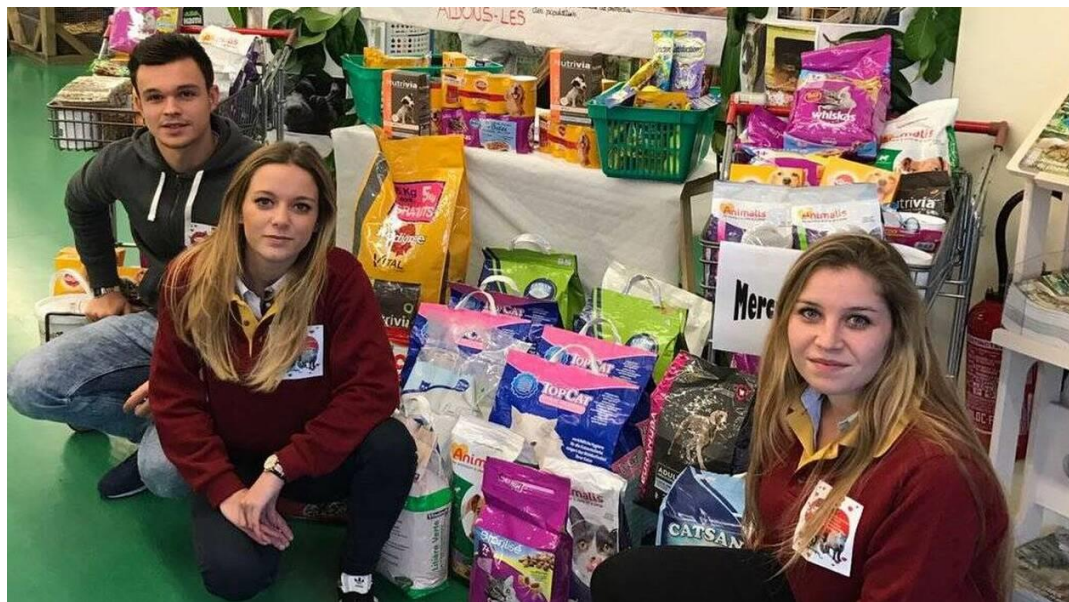
Des étudiants lors d'une action dans une jardinerie

Avec 132 étudiants dans les deux établissements conduisant des formations supérieures, le lycée des Andaines et la MFR-CFTA, les formations supérieures se développent avec quatre options de BTS et une licence professionnelle. Par contre, l'apprentissage prend une plus grande place dans toutes les préparations à ces qualifications.